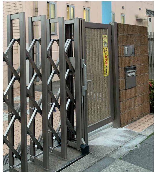
メインゲートの扉横にインターホンを設置